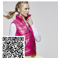
MONTANA WOMAN RA5084